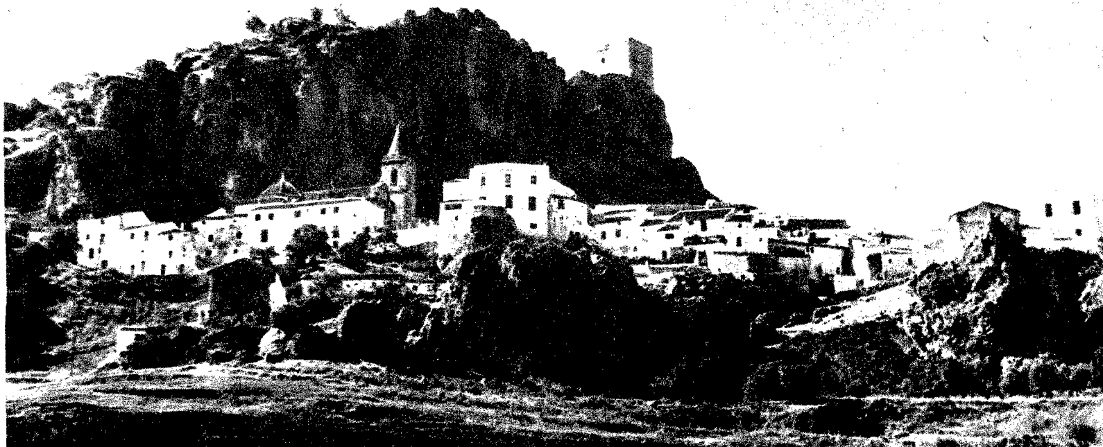
Zahara, recostada al pie de su fortaleza. Abajo, a la izquierda de la fotografía, la iglesia parroquial de Santa María de la Mesa. En el grabado superior, una vista parcial.