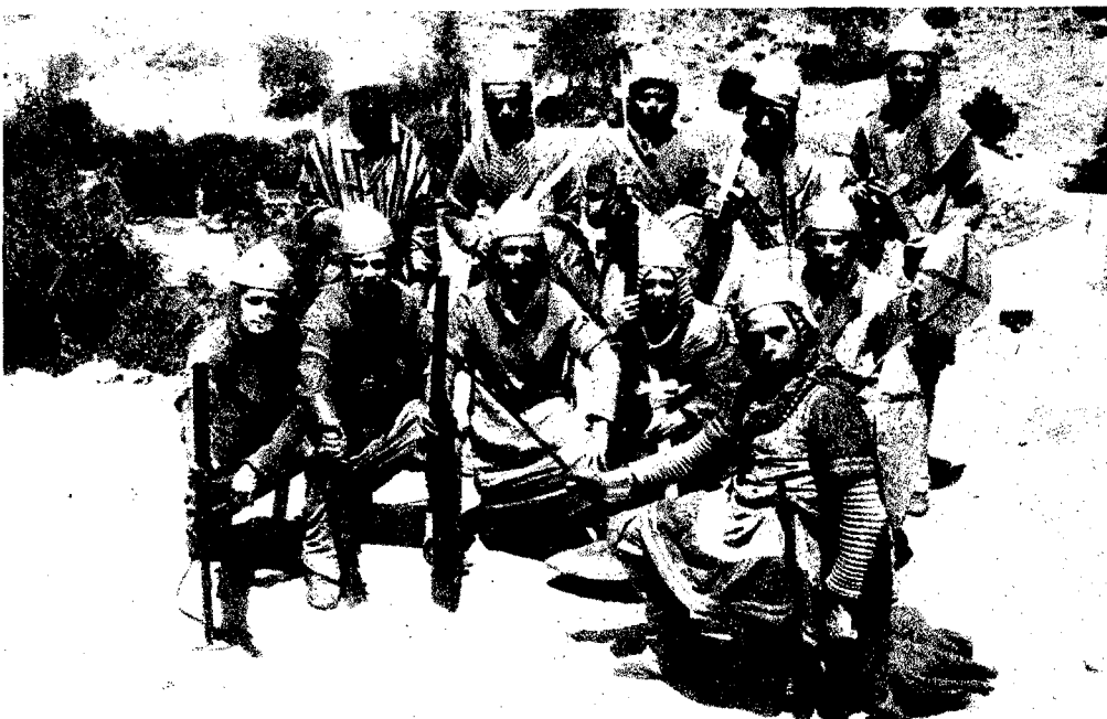
El bando "cristiano".

Cuando, terminadas las "guerrillas", el paso de San Antonio se ha colocado en la plaza en espera de ser trasladado a la casa designada, los dos bandos de moros y cristianos van haciendo prisioneros a los que han formado en el acompañamien-